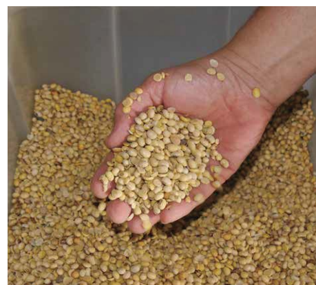
tostirana punomasna soja